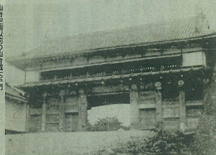
仙台空襲以前の仙台城大手門

仙台市の復元計画が滞っている仙台城の大手門について、既存の作業用道路を迂回路にする整備案が浮上した。大手門跡は現在、市道交差点となっており、迂回路の整備が課題。検討次第では早期実現に向けて、計画が動き出す可能性が出てきた。