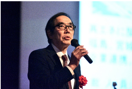
②⑧講演の様子：国立研究開発法人産業技術総合研究所 福島再生可能エネルギー研究所 所長 中岩 勝 様（11月6日）