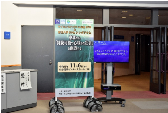
㉑会場：仙台国際センター大ホール (11月6日)