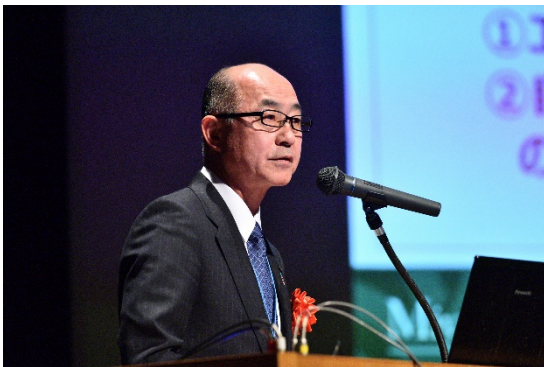
㉒講演の様子：宮城県副知事 遠藤 信哉 様（11月6日）