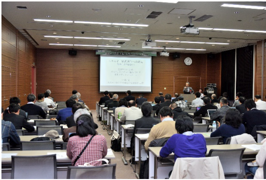
⑭会場内の様子（片平さくらホール：11月5日）