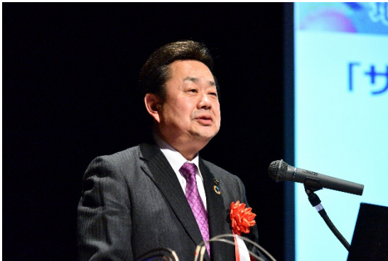
⑳講演の様子：宮城県富谷市長 若生 裕俊 様（11月6日）