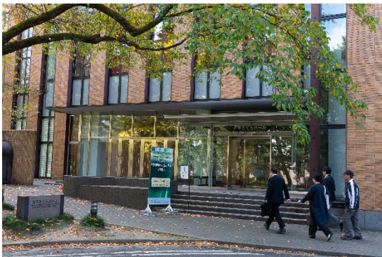
⑬会場外観：片平さくらホール（11月5日）