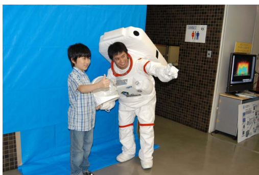
1号館展示・ロケットブリクラ