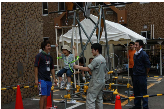
2号館前展示・体験しよう！！蒸気のカ