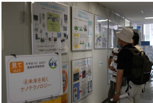
2号館展示・未来を拓くナノテクノロジー