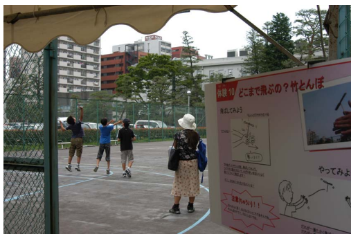
テニスコート展示・どこまで飛ぶの？竹とんぼ