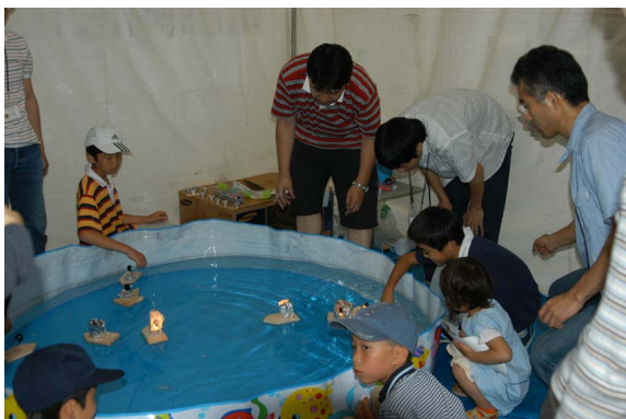
1号館前展示・蒸気船で遊ぼう！