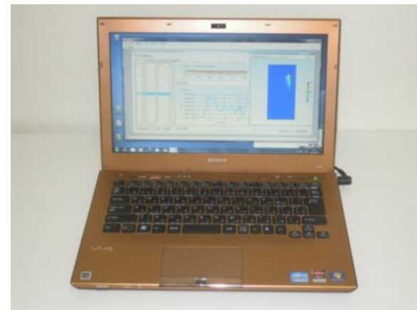
形状・ダメージ予測