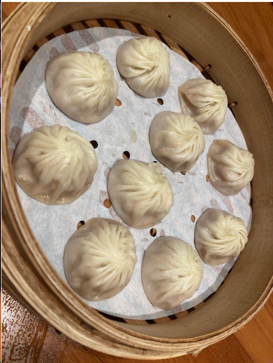
台湾料理として有名な小籠包