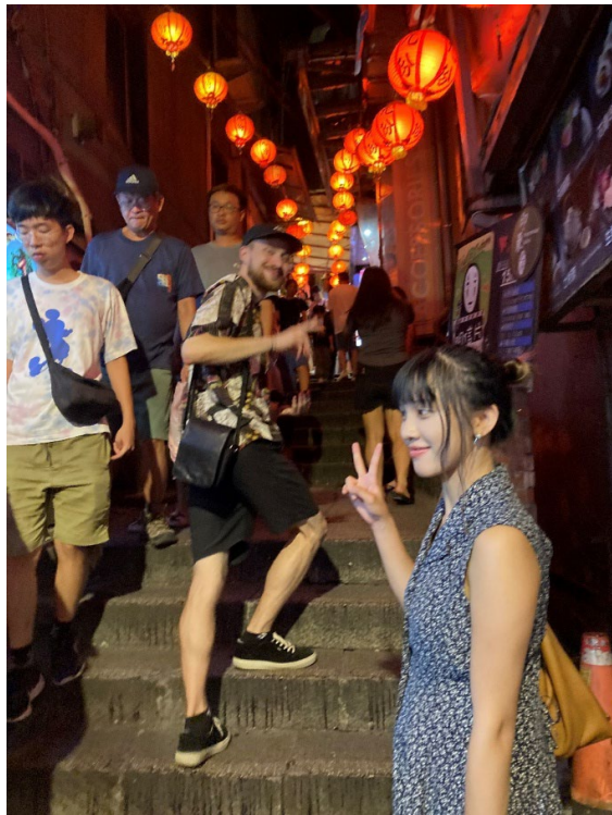
台湾の友人との旅行中の写真