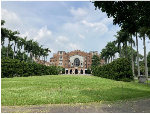
台湾大学の図書館の正面からの写真