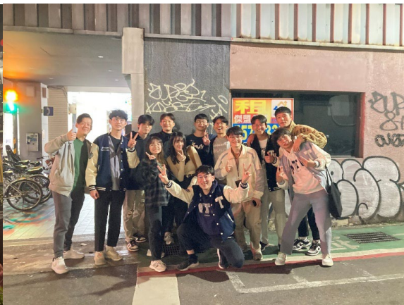
台湾でできた友人との集合写真