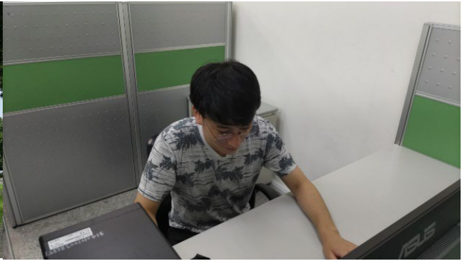
研究室での私の様子